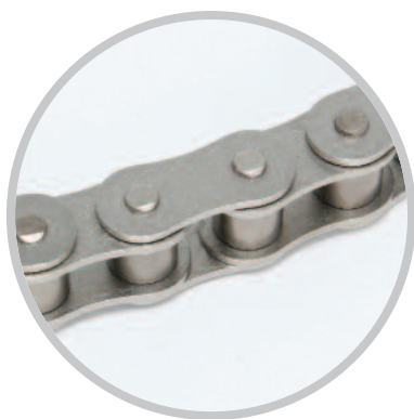
Łańcuchy z powłoką niklową