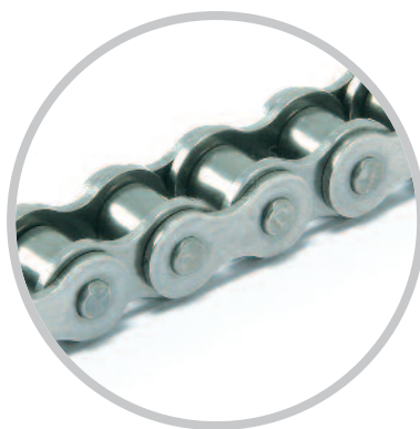
Łańcuchy ze stali nierdzewnej